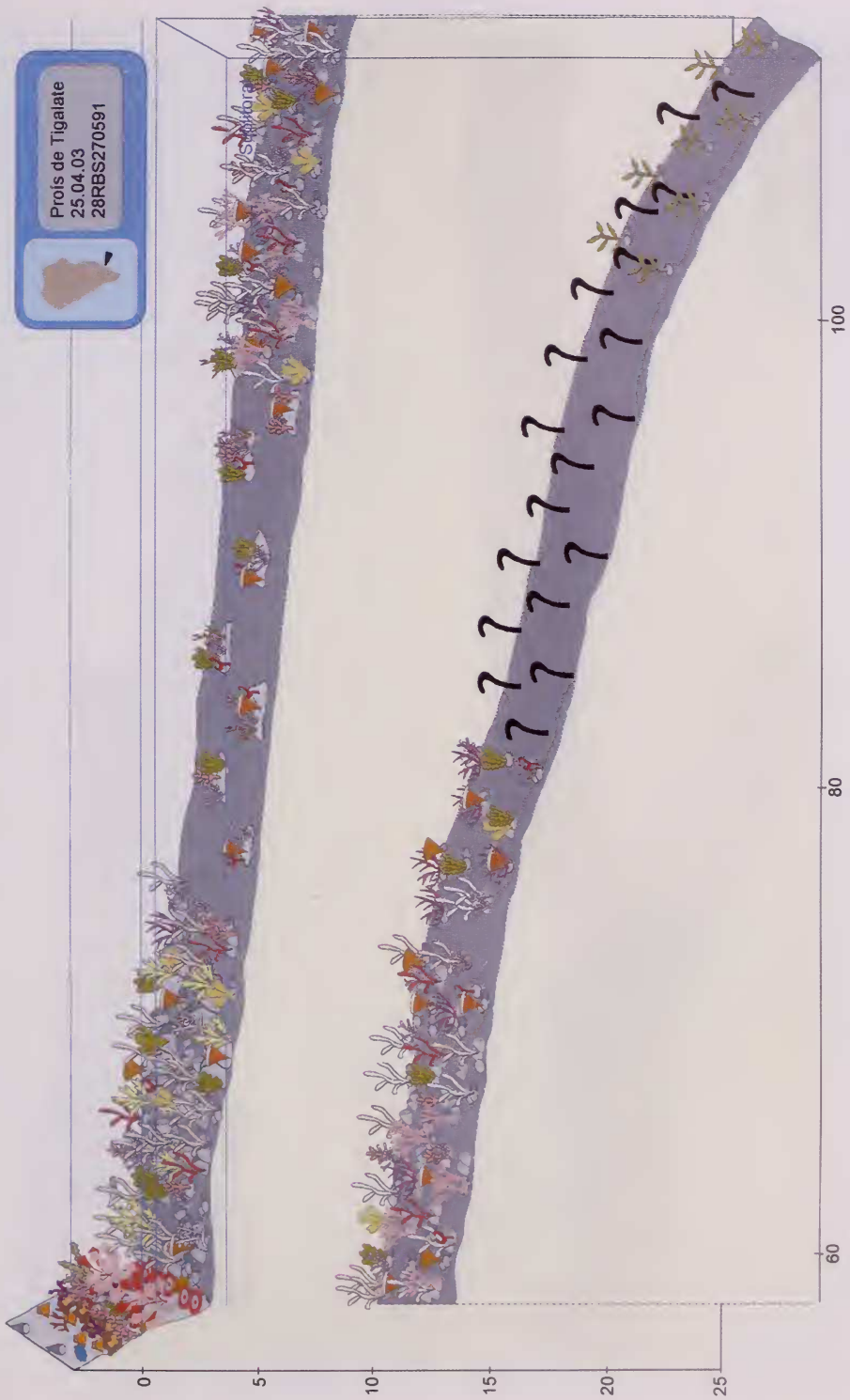
Fig. 2. Prois de Tigalate. Esquema del perfil del litoral con la zonación de las especies dominantes.